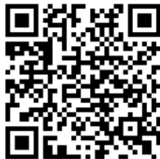
Código QR para validación en sede

Regulación CSV: Decreto 3628/2017 de 20-12-2017